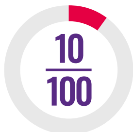
Índice de cobertura do tratamento em massa de DTN

Este perfil faculta uma panorâmica do progresso de Angola quanto ao benefício de todos aqueles que necessitam de tratamento contra as cinco DTN mais comuns, com base nos dados de 2017 comunicados à Organização Mundial da Saúde (OMS) pelo país. Esta informação é usada para calcular o índice de DTN que surge no Quadro de Pontuação da Aliança de Líderes Africanos contra a Malária (ALMA) para a Responsabilização e a Ação e para o relato sobre o ODS 3.3 e a cobertura sanitária universal.