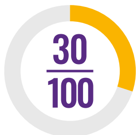
Indice de couverture relatif au traitement de masse des MTN

Cette fiche de synthèse présente les progrès du Congo dans le traitement des cinq MTN les plus communes pour tous ceux qui en ont besoin, sur la base des données 2017 transmises par le pays à l'OMS. Ces informations servent à calculer l'indice MTN qui figure dans le cadre d'évaluation « Redevabilité et Action » de l'Alliance des dirigeants africains contre le paludisme (ALMA), et sont utilisées pour établir les rapports de progression relatifs à l'ODD 3.3 et à la Couverture sanitaire universelle (CSU).