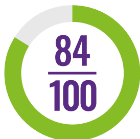
Indice de couverture relatif au traitement de masse des MTN

Cette fiche de synthèse présente les progrès du Togo dans le traitement des cinq MTN les plus communes pour tous ceux qui en ont besoin, sur la base des données 2017 transmises par le pays à l’OMS. Ces informations servent à calculer l’indice MTN qui figure dans le cadre d’évaluation « Redevabilité et Action » de l’Alliance des dirigeants africains contre le paludisme (ALMA), et sont utilisées pour établir les rapports de progression relatifs à l’ODD 3.3 et à la Couverture sanitaire universelle (CSU).