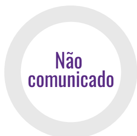
Índice de cobertura do tratamento em massa de DTN

Este perfil faculta uma panorâmica do progresso de São Tomé e Príncipe quanto ao benefício de todos aqueles que necessitam de tratamento contra as cinco DTN mais comuns, com base nos dados de 2017 comunicados à Organização Mundial da Saúde (OMS) pelo país. Esta informação é usada para calcular o índice de DTN que surge no Quadro de Pontuação da Aliança de Líderes Africanos contra a Malária (ALMA) para a Responsabilização e a Ação e para o relato sobre o ODS 3.3 e a cobertura sanitária universal.